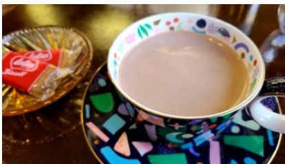
タイトル:「ジャズとホットとチョコとクッキーと」

メッセージ: 何時もより帰るのが遅くなった。毎日、目にしている小道が今日はやけに幻想的に視えた。